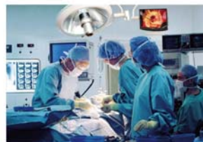
Operating Table with Shadowless lamp